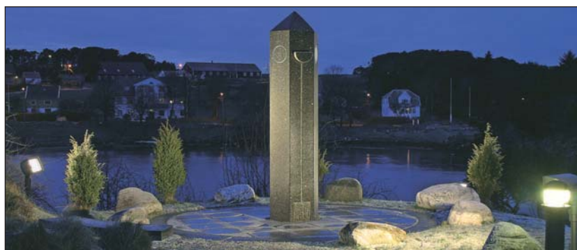
Til minne om havariet reiste GC Rieber Fondene i 1997 en bauta på Herdla