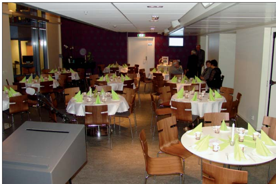
Den nye kafeen

Helt siden 1924 har Salem hatt som mål å være samfunnsengasjert og ta vare på mennesker, både sosialt og åndelig. Virksomheten omfatter barne- og ungdomsarbeid, studentaktiviteter, arbeid blant eldre og trengende, samt misjons- og bistandsarbeid i andre land. For å kunne utvide aktivitetene ble den gamle Turnhallen i Bergen overtatt i januar 2007. GC Rieber Fondene medvirket til finansieringen for å gjøre de nye lokalene best mulig egnet til møtevirksomhet, kafé, barnehage og eldretreff.