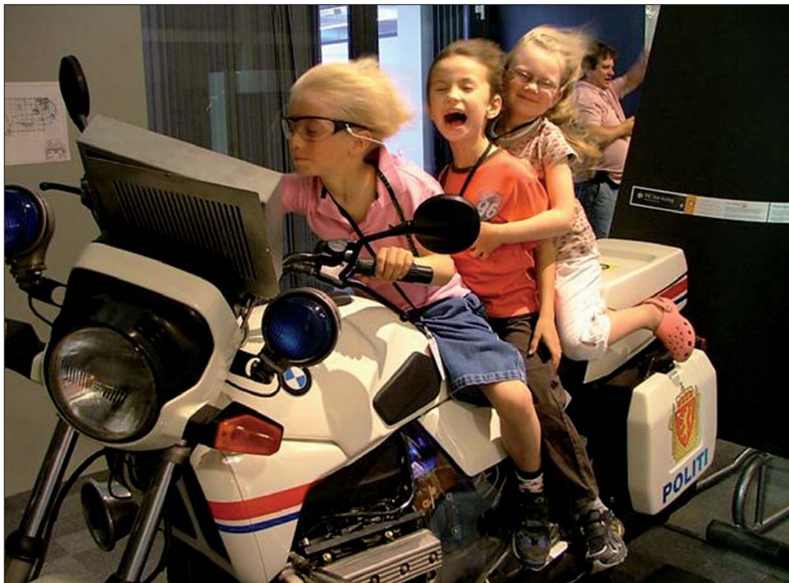
Full fart på VilVite

For å bedre tilkomstmulighetene til VilVite har Fondene finansiert ny portåpning til Nygårdsparken. Dette vil gi gående fra buss og fremtidig bybane en enklere og bilfri tilgang til VilVite.