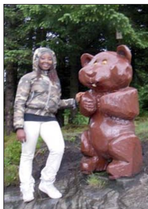
Baindu og Bjørnen på Smøråsfjellet