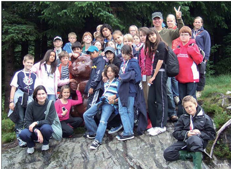
Ungdom rundt Bjørnen på Smøråsfjellet

I hele juli 2008 var nærmere 50 jevnaldrende barn fra 12 forskjellige nasjoner samlet på Ravnanger ungdomskole og Hop Ungdomskole. Ved lek og fritidsaktiviteter lærte de hverandre å kjenne. Mens noen spilte volleyball eller fotball, gikk andre til skogs for å studere naturen. Utfluktene i Bergensområdet, blant annet Smøråsfjellet, var særlig populære. Ved felles opplevelser skapes vennskap og toleranse, som forhåpentligvis varer hele livet.