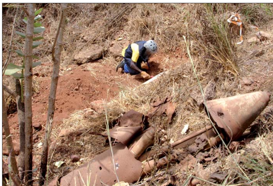
Bomberydder i farlig arbeid