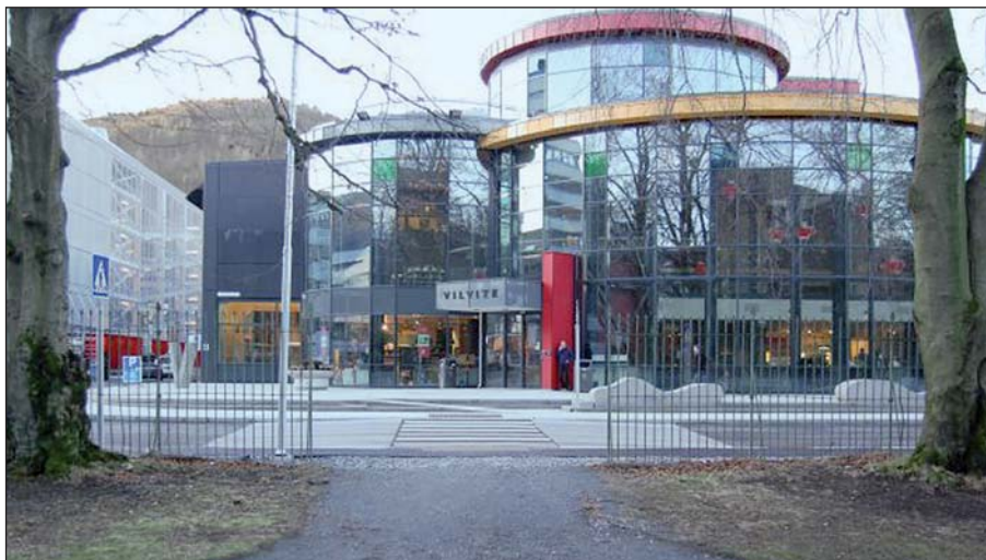
Den nye porten i Nygårdsparken

Siden starten i mai 2007 har Vitensenteret opparbeidet høy internasjonal standard med høye besøkstall sammenlignet med andre europeiske Vitensentre.