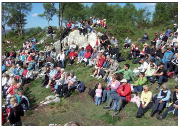
Folkesamling på Smøråsfjellet

Det er enda ikke klart hvorledes forvaltningen av Smøråsfjellet vil bli når den offentlige forvaltningsplanen blir vedtatt. Dugnadsgjengen, som nå består av 22 pensjonister, har et nært samarbeid med Bergens Skog- og Træplantningselskap. Et formalisert samarbeid kan være hensiktsmessig, ikke bare i forbindelse med dugnadsarbeidet på Smøråsfjellet, men også med andre dugnadsgjenger som nå planlegges i Bergensområdet.