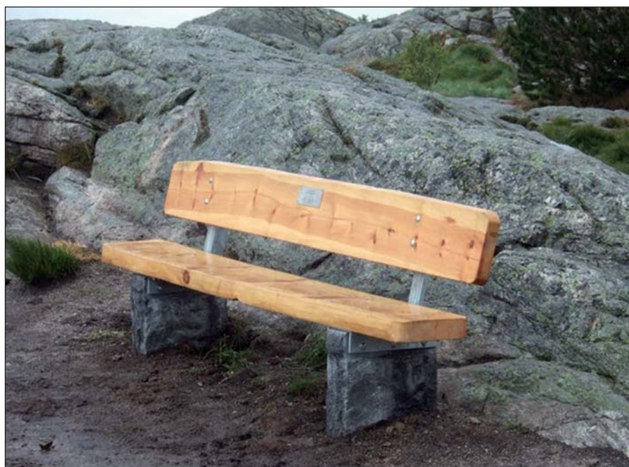
En av benkene på Sandviksfjellet

I naturen ruver fjellene, i hjemmet bagatellene Jorden trenger ikke menneskene, men menneskene trenger jorden Ære være den som får to strå til å vokse, der det før var ett Det er ikke fjellet du overvinner men deg selv Ein kjem ikkje til fjells på ein flat veg Det er i motbakke det går oppover. Fjellet er vår felles fremtid