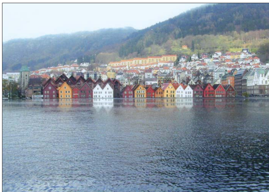
Bryggen under vann

GC Rieber Klimainstitutt har i over 11 år vært engasjert i klimaforskning. Når Grieg Foundation sammen med Kavlistiftelsen, Sparebank Vest og Sparebankstiftelsen DnB NOR nå ønsker å etablere et samarbeid for å løse konkrete miljøutfordringer i Bergensregionen, er det naturlig at også GC Rieber Fondene deltar i et slikt prosjekt.