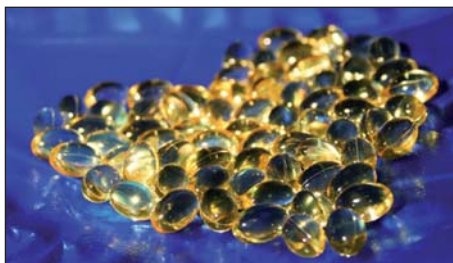
Bruk av marine oljer videreføres i våre dager gjennom utstrakt bruk av omega 3 oljer av sel og fisk