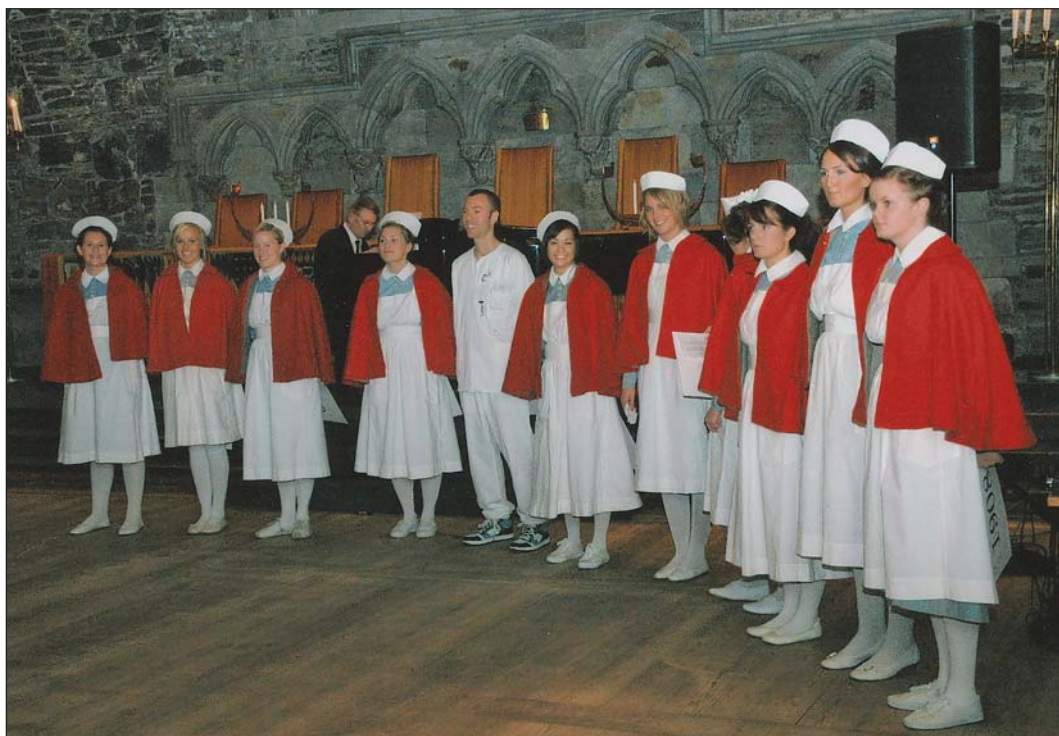
Sykepleierstudenter ved Høgskolen i Bergen

I forbindelse med at det i 2008 var 100 år siden Høgskolen i Bergen etablerte sykepleierutdanning, og 50 år siden Musikklinjen ble fag ved lærerutdanningen, ønsket skolen å markere de to jubileene ved et faglig seminar om musikkterapi. På bakgrunn av at musikkterapi i flere år har vært et av de største satsingsområdene ønsket GC Rieber Fondene å finansiere et heldags seminar i den store salen Magnus Barfot. Den 19. november ble det i samarbeid med Griegakademiet gitt en bred presentasjon om betydningen av slik terapi i eldreomsorgen. Flere av foredragsholderne belyste hvorledes musikkterapi kan gi positive, helsefremmende muligheter. Over 200 studenter, lærere, representanter fra pleie og omsorgstjenestene i Bergen Kommune og sykehjem deltok på seminaret. Det ble konkludert med at Høgskolen vil implementere kunnskap om musikkterapi i utdanningen.