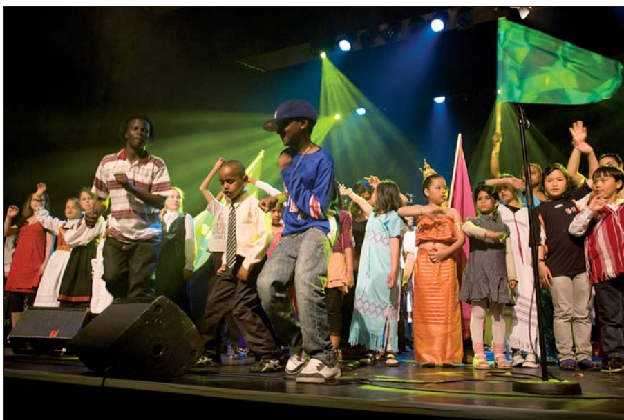
Fargespill forener ungdom fra mange kulturer

For å integrere ungdom gjennom kunst og kultur i det norske samfunnet, besluttet Byrådet i Bergen i 2008 å etablere en fastere struktur og en styrket ramme for videreføring av prosjektet. For flere av aktørene er medvirkning i Fargespill deres første møte med norsk kultur og språk. I tillegg til å være en kunstnerisk smeltedigel, er målet å utvikle prosjektet slik at det også kan brukes i arbeidet med integrering i asylmottak og kulturskoler. Fondene mener at dette er en praktisk og positiv form for å skape toleranse, respekt og åpenhet, og har derfor ønsket å støtte prosjektet.