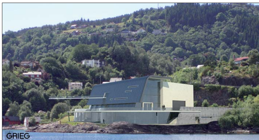
Det planlagte kulturhuset

Da Per Grieg sr. tok initiativet til å bygge et kunstmuseum i verdensklasse, ble forslaget godt mottatt i Os Kommune. Prosjektet er nå videreutviklet til et fullverdig kunst- og kultursenter med følgende hovedkomponenter: museum, stor-sal med 600 sitteplasser, øvingsrom, resepsjonsområde og uteområde med skulpturpark. Et slikt senter med både kunstmuseum og kulturfasiliteter vil være unikt i Norge. Senteret vil dekke lokale behov i Os Kommune, men vil også få en viktig funksjon som arena for produksjon og formidling av kunst og kultur i Bergensregionen. Senteret vil bli plassert på Mobergsneset som er en av de flotteste tomtene i Bergensregionen med nær kontakt til det vestlandske fjord- og fjellandskapet. Selv om senteret vil være i utkanten av GC Rieber Fondenes primære satsingsområde, ønsker Fondene å medvirke til at prosjektet kan realiseres.