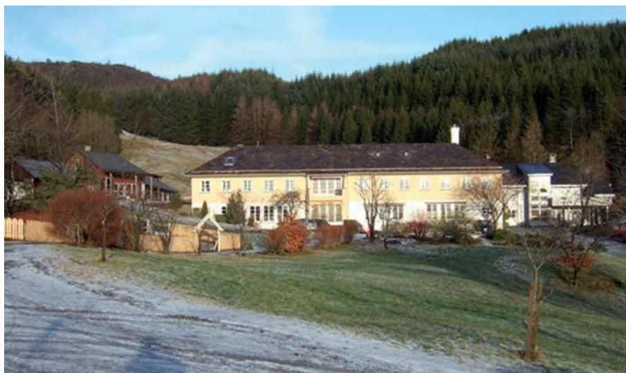
Det første huset på Helgeseter

Av flere grunner var det ikke mulig å realisere de første planene, og nye forenklede tegninger er nå utarbeidet. Dersom Bergen Kommune kan akseptere at Helgeseter opptar lån for ca. halvparten av byggekostnadene, vil GC Rieber Fondene straks kunne ta standpunkt til å øke sin tidligere bevilgning.