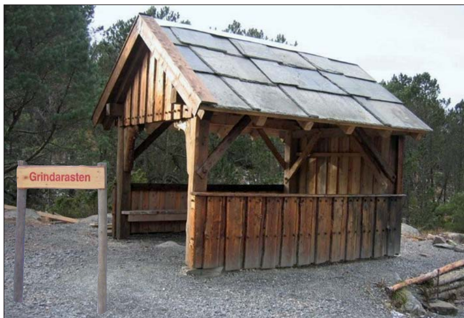
Det nye grindabygget