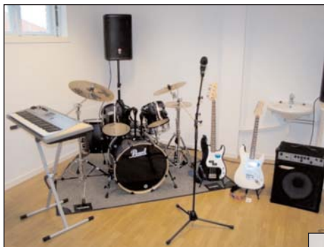
Musikkinstrumenter kjøpt til Björgvin Fengsel

Björgvin Fengsel ble åpnet i oktober 2006 med plass for 90 innsatte. Ifølge en Fafo rapport fra 2004 har 70 % av innsatte rusproblemer. Der er gode eksempler på at rus og kriminalitet kan reduseres ved meningsfylte fritidsinteresser. På bakgrunn av at GC Rieber Fondene har vært, og fortsatt er, sterkt involvert i etablering av musikkterapi i eldreomsorgen, og også ved Griegakademiet, var det naturlig også å medvirke til at Björgvin Fengsel kan gi tilbud om musikkterapi til domfelte. Et bredt utvalg av gode musikkinstrumenter ble derfor innkjøpt. Fengselsledelsen mener at bruk av musikk kan bygge opp selv tilliten og gode relasjoner. Musikken gir glede og følelse av mestring, og gir innsatte mulighet til å uttrykke sorg og frustrasjon på en trygg måte. Som et av flere tiltak prøves nå musikkterapi som et virkemiddel for å redusere fremtidig kriminalitet.