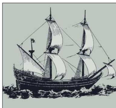
De Zee Ploeg