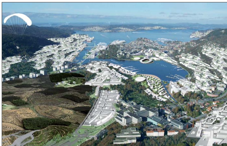
Arkitektforeningens visjon for Bergen i 2108

Da Bergen Arkitektforening ønsket å markere sitt 100 års jubileum ved å utgi en bok med et utvalg av byens arkitektur, sa Fondene seg villig til å medvirke til det, under den forutsetning at visjoner for byens utvikling i de neste hundrede år også ble presentert. Siden middelalderen har Bergens befolkning tredoblet seg hvert hundrede år. Dersom denne utviklingen fortsetter i samme tempo vil det være over en million bergensere i år 2108. I sine planer for fremtiden gir Arkitektforeningen uttrykk for at det er stor forskjell på den provinsielle utbygging som har funnet sted i Bergen i de siste 50 årene, og den fortetting som nå tvinger seg frem. Ved å bygge ut fjellsiden vil det være mulig å ta vare på den historiske bykjernen. For å gjennomføre den dramatiske omstillingen som blir nødvendig, må det ryddes opp i miljøbegrepet, og det må skapes et klarere skille mellom natur, som en estetisk størrelse, til fordel for energieffektive løsninger.