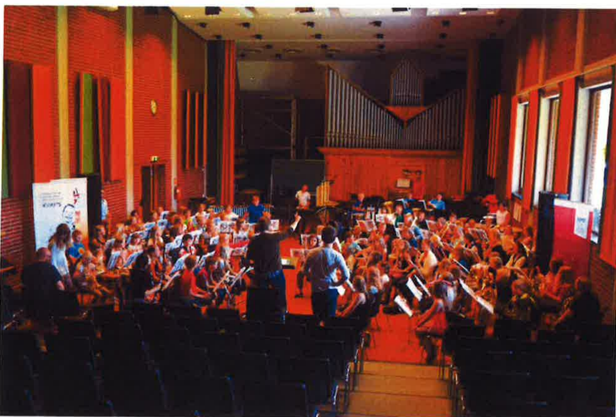
Norges Musikkorps forbund sine sommerkurs på Toneheim