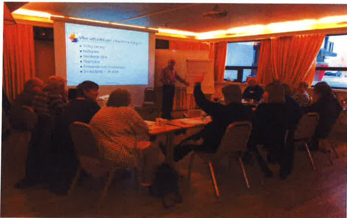
Kurs i kommunikasjon – Studieforbundet FUNKIS

Samme statistikk viser at Studieforbundene som har den største kursaktiviteten målt i timer er Kristelig Studieforbund(22,1 %) Studieforbundet Folkeuniversitetet (20,9 %) og Studieforbundet kultur og tradisjon(15,8 %). Til sammen står disse tre studieforbundene for 59 % av kursaktiviteten i Oppland.