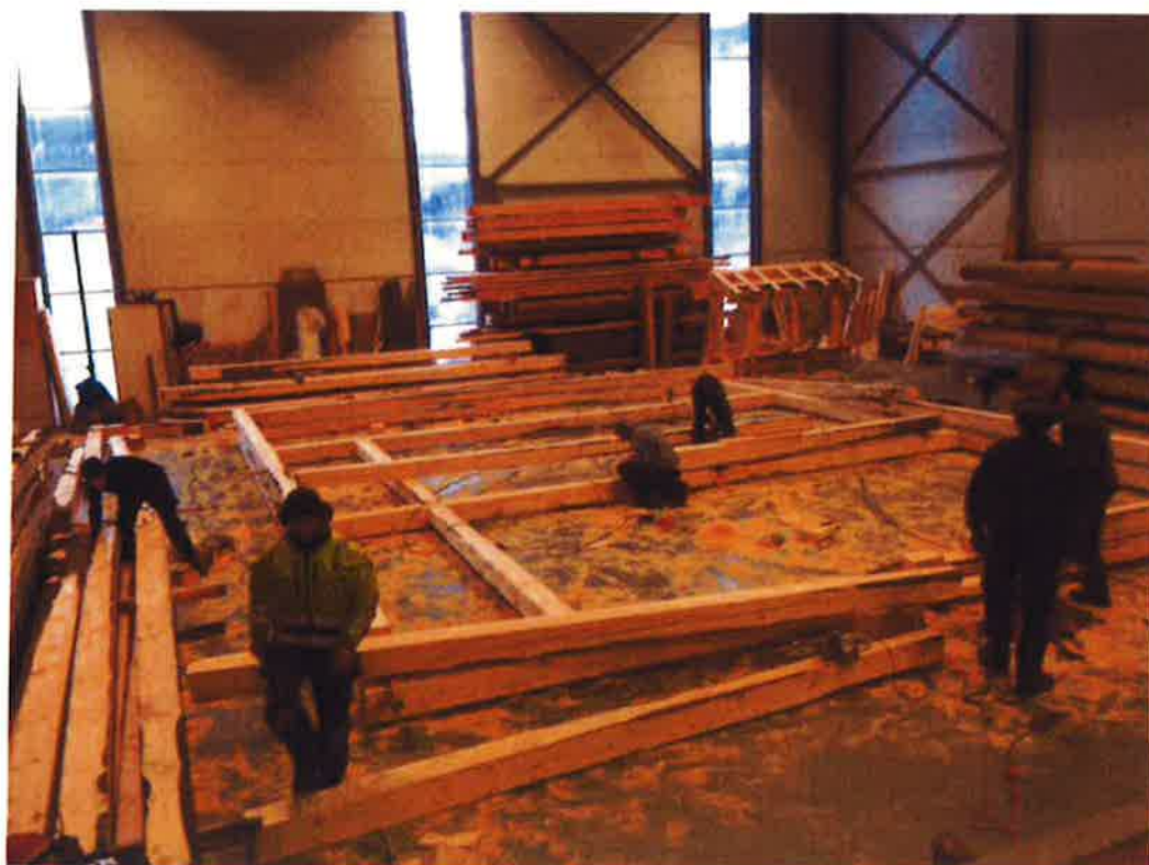
Kurs for byggebransjen i "Reiste konstruksjoner" i regi av Senter for Bygdekultur-Dovre