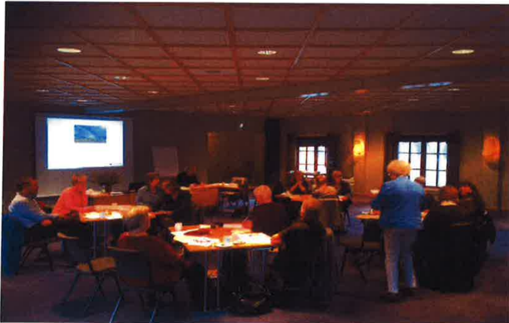
Seminar i Voksenpedagogikk i samarbeid med VOX og Voksenopplæringsforbundet sentralt

Seminaret berørte tema som motivasjon for læring, om læring i sosiale fellesskap, og voksenpedagogikk i praksis. Det var 17 deltakere fra ulike frivillige organisasjoner som driver med kurs og opplæring.