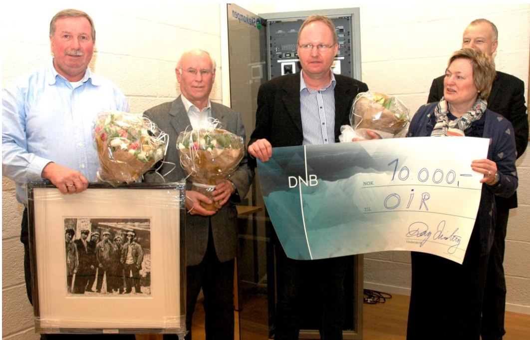
Utdeling av Voksenopplæringsprisen 2013 på fylkestinget - Thon Hotell Skeikampen 19 februar 2014.

Voksenopplæringsprisen ble opprettet i 2006 av Oppland Fylkeskommune og VOFO Oppland i samarbeid.