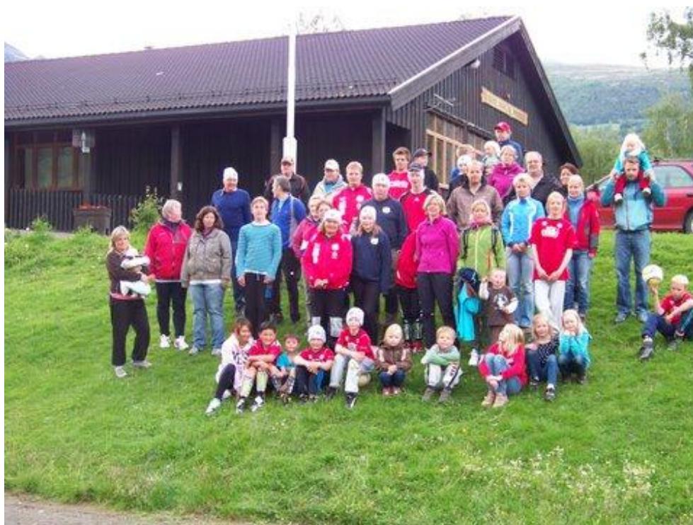
Premieutdeling – trenerkurs – Sjørdalen idrettslag