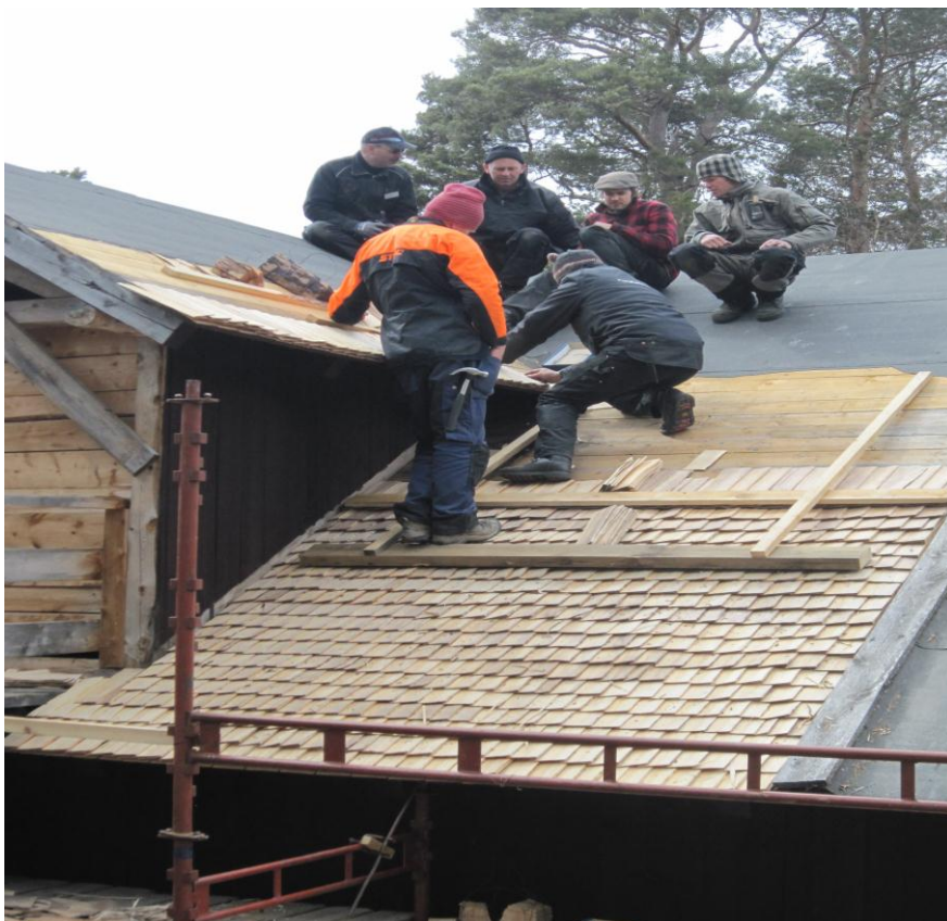
Kurs i spontekking i regi av Senter for bygdekultur - Dovre