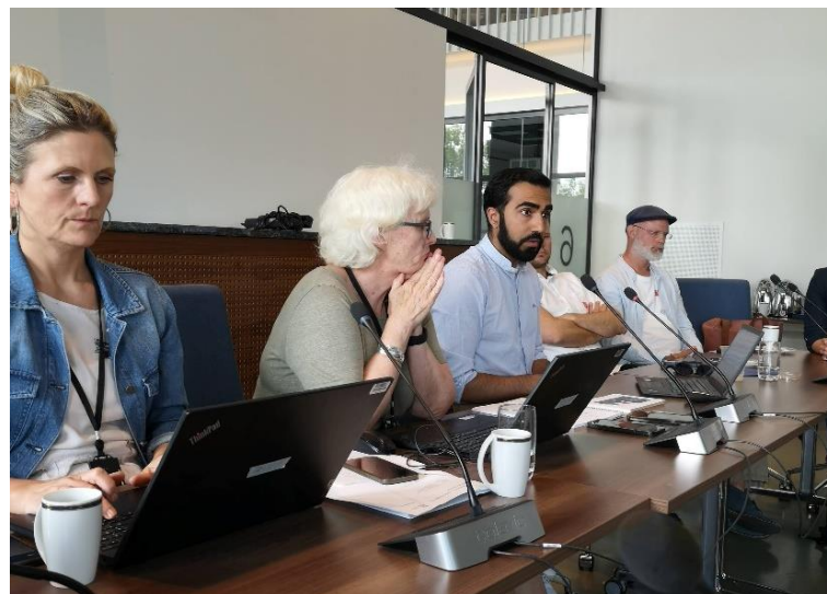
Dialogmøtet med Oslo kommune

En fast rådgiver i Vofo sentralt, følger opp fylkesutvalget og arbeidet i Oslo.