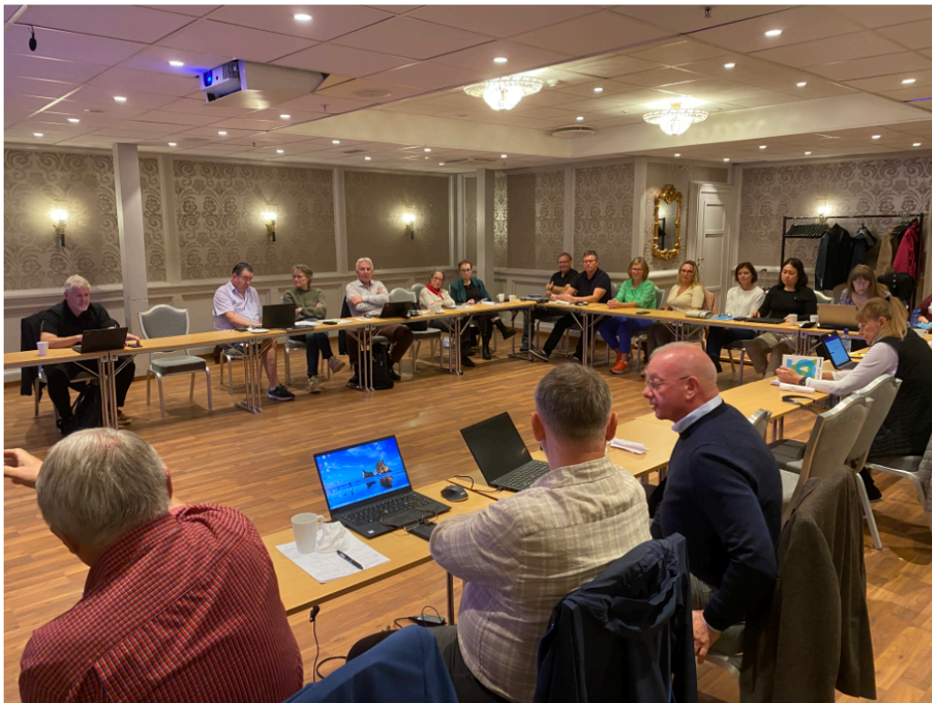
Fylkesledersamling i Fredrikstad

Samlingen markerte starten på arbeidet med regionale handlingsplaner for 2024.