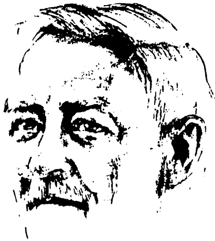
DR. MILTON H. ERICKSON